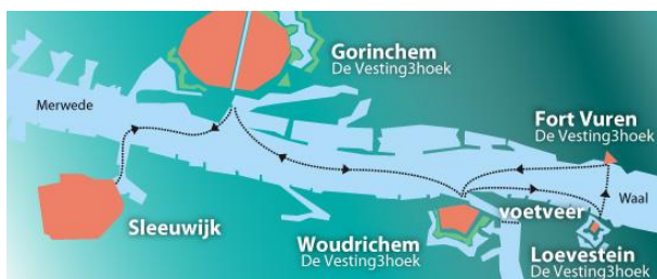
Met de veerdienst

Na 6 minuten lopen ziet u aan de linkerkant, recht voor u Hipper & Kolfbaan.