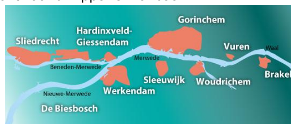
Met de water