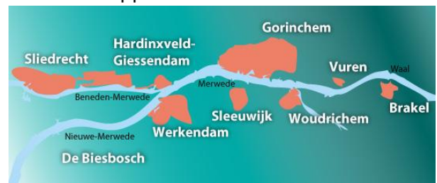
Met de water