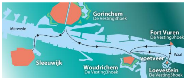
Met de veerdienst

Na 6 minuten lopen ziet u aan de linkerkant, recht voor u Hipper & Kolfbaan.